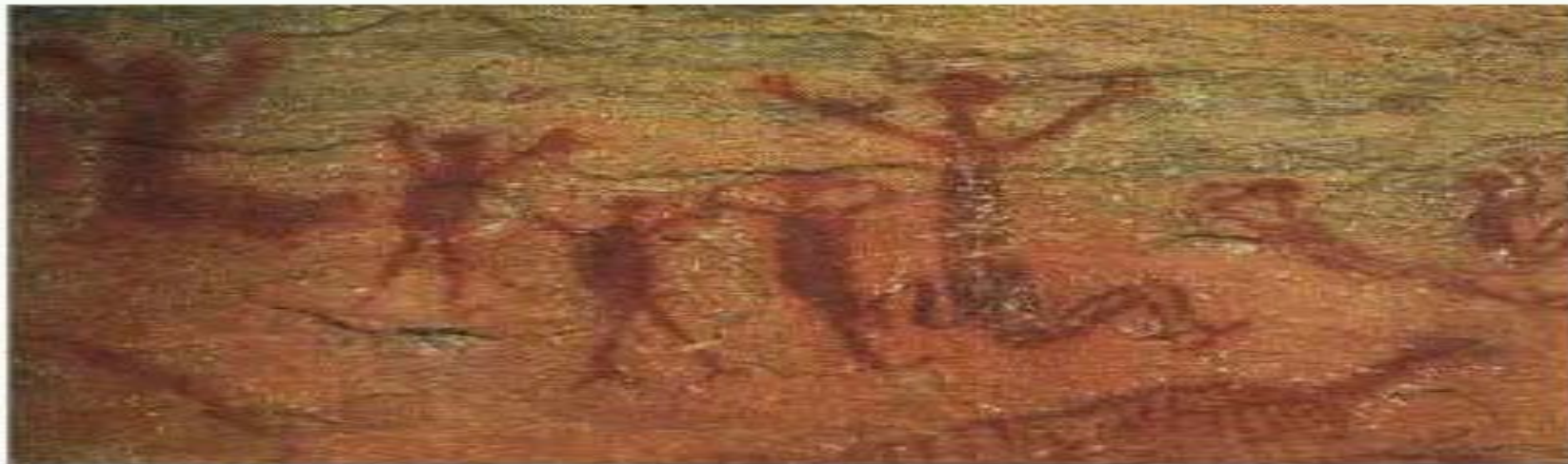
Serra da Capivara, Piauí, Brasil